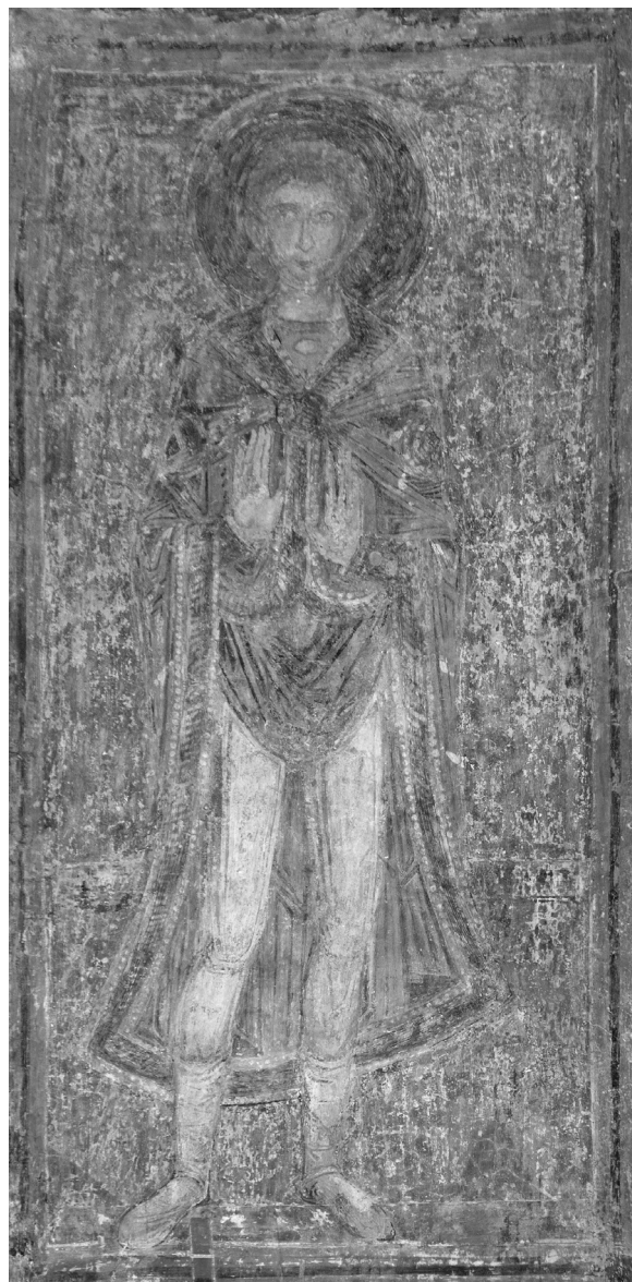
Рис. 3. Святий отрок Азарія. Фреска XI ст.

і археолога XIX ст. Ф. Солнцева. Він так ідентифікував отроків (знизу вгору) – Місаїл, Азарія, Ананія (Киевский Софийский собор 1887, рис. 35). З такою атрибуцією погодилася радянська дослідниця І. Головань (Головань 1973, с. 47).