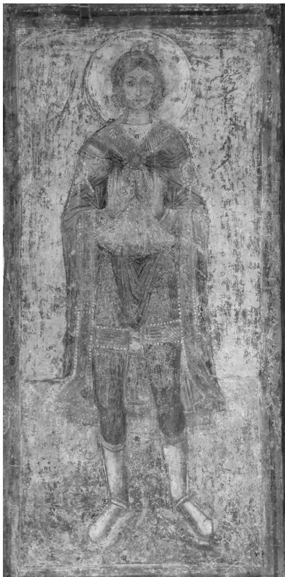
Рис. 2. Святий отрок Місаїл. Фреска XI ст.