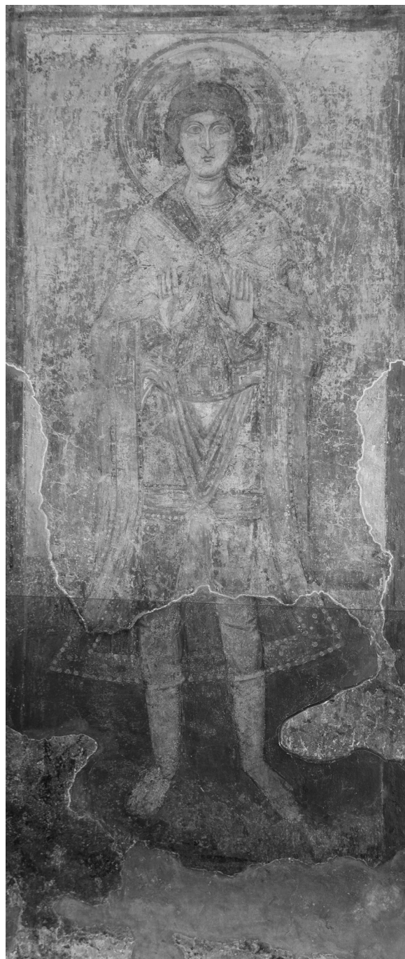
Рис. 1. Святий отрок Ананія. Фреска XI ст.

Зображення отроків у центральній наві Софії Київської виконано мінеральними фарбами в техніці фрески в першій половині XI ст. Юнаки стоять з молитовно розкритими перед грудьми долонями, одягнені в короткі підперезані хітони, поверх яких – довгі плащі, застібнуті на грудях