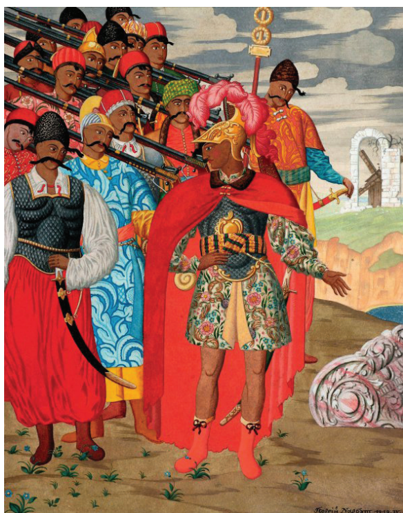
Рис. 1. Г. Нарбут. Еней та його військо. 1919. Зібрання Харківського художнього музею