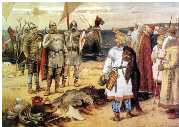
Рис. 5. В. Васнецов. Закликання варягів. 1909

Леві-Строс вважав, що міфологія та наука мають спільну сутність. Пол Феєрабенд наголошував на тому, що поширення сцієнтизму та наївного раціоналізму аж ніяк не вплинуло на присутність у суспільній свідомості більш давніх моделей мислення, зокрема містичного,