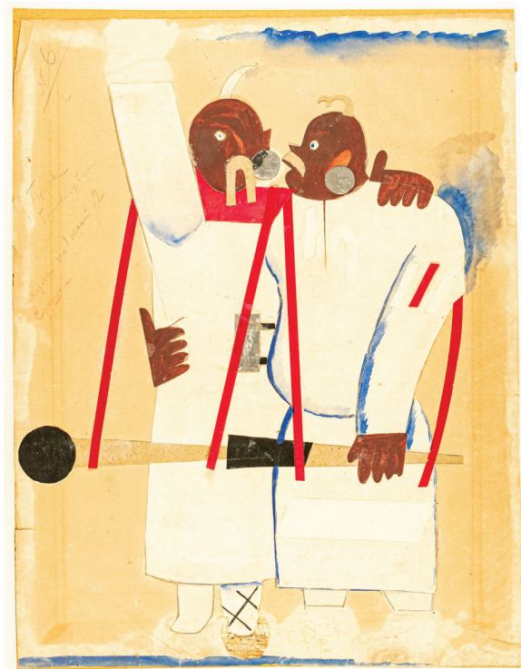
Рис. 4. А. Петрицький. Скула і Єрошка (до опери «Князь Ігор»). 1926. Зібрання Музею театрального, музичного та кіномистецтва України

досліджень К. Леві-Строс намагається віднайти раціональні пояснення фізичної дієвості чаклування в «примітивних» суспільствах. Він виділив три компоненти (використаємо термін «тріангуляція»), які забезпечують дієвість обряду: віра чаклуна, віра об'єкта чаклування, «довіра й вимоги колективної думки» (Леві-Строс 2000, 157). Екстраполюємо наведені антропологічні міркування на ситуацію, пов'язану з примітивною, архаїчною російською ідентичністю.