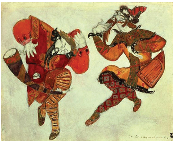
Рис. 3. Н. Реріх. Скула і Єрошка (до опери «Князь Ігор»). 1914

Спробуємо аргументувати, чому запропонована спадщинна методологія та ґрунтовані на ній технології можуть спрацювати. В одному зі своїх